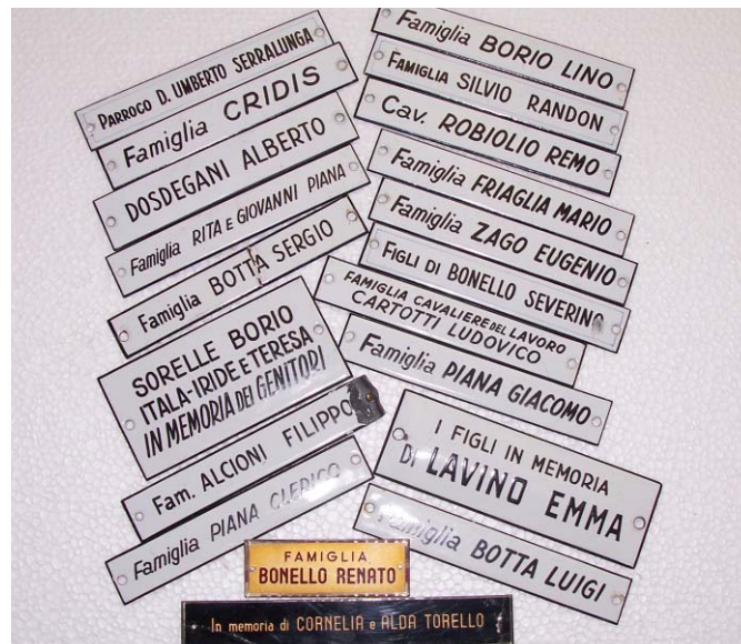
Chi aveva donato un banco